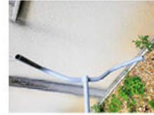
Vous avez dit PLANIFICATION : bah, on fait quoi avec ça après ?