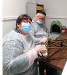
Vous avez dit RÉADAPTATION : il faut réapprendre les gestes.