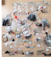
Vous avez dit ATTENTION : il faut s'y retrouver !

Paroles de patient : "Le groupe m'a donné le goût de m'intéresser à quelque chose de minutieux, maintenant je fais des maquettes, c'est mon fil rouge !"